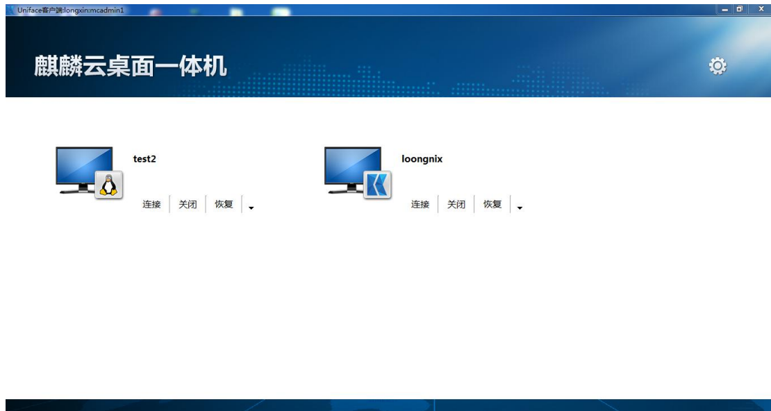
图 2- 2

该用户拥有两个桌面，一个 Kylin（龙芯版）操作系统桌面，一个 Windows 操作系统桌面。