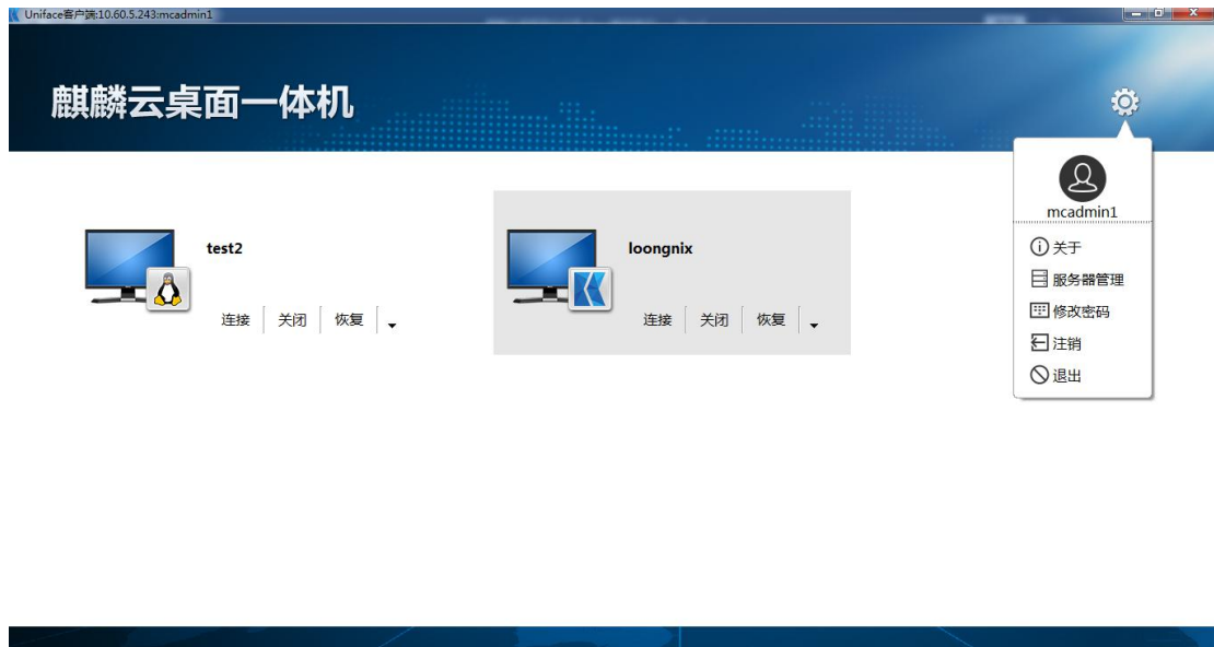
图 2- 6