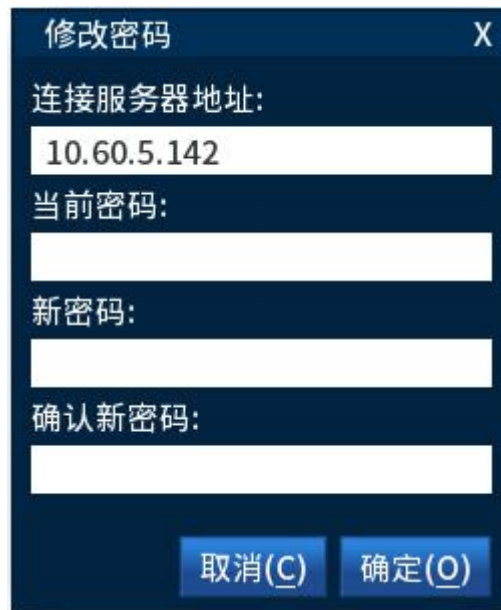
图 2- 7